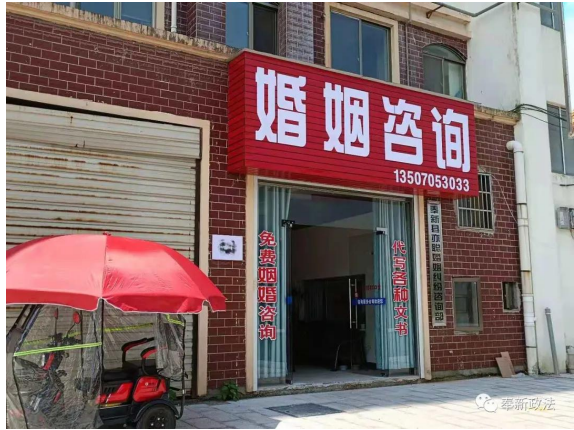
整治前后的家庭婚姻纠纷服务所