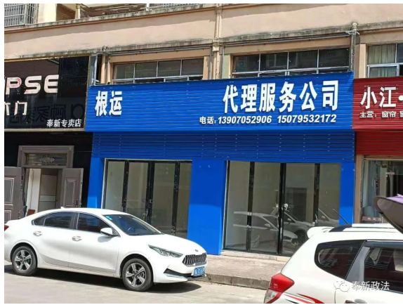
整治前后的根运交通事故理赔服务公司