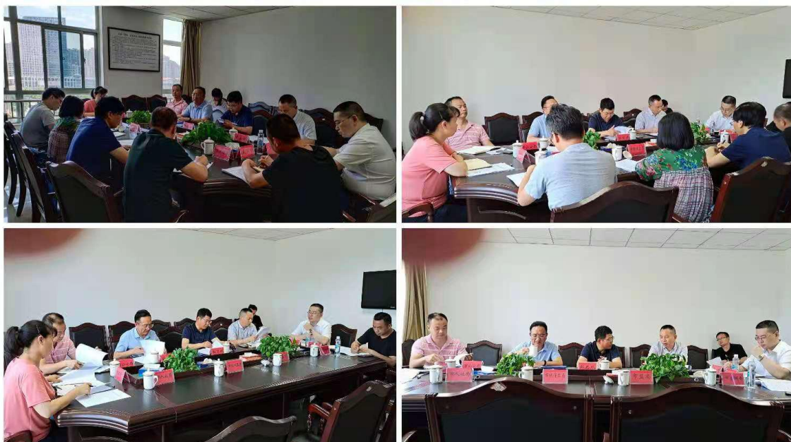
宜春市法律服务市场专项整治行动方案征求意见座谈会

为规范我市法律服务市场秩序，维护当事人的合法权益，优化法律服务环境，满足人民群众的法律服务需求。2021年6月7日，由市司法局牵头，联合市中级人民法院、市人力资源社会保障局、市公安局、市卫生健康委、市市场监督管理局、宜春银保监分局，并邀请市委政法委分管领导召开座谈会。经研究，制定此《工作方案》。