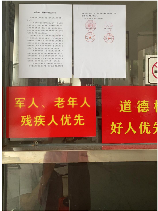
在医院等地张贴《致伤残人员和家属告知书》