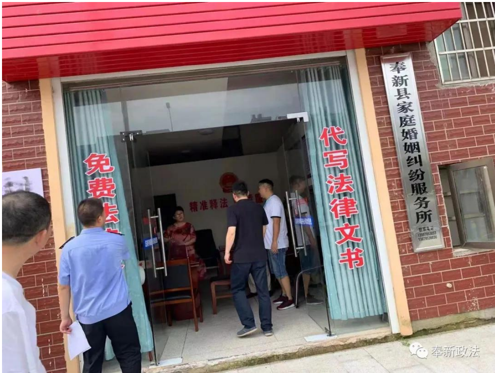
多部门联合开展法律服务市场专项整治行动工作 (家庭婚姻纠纷服务所)